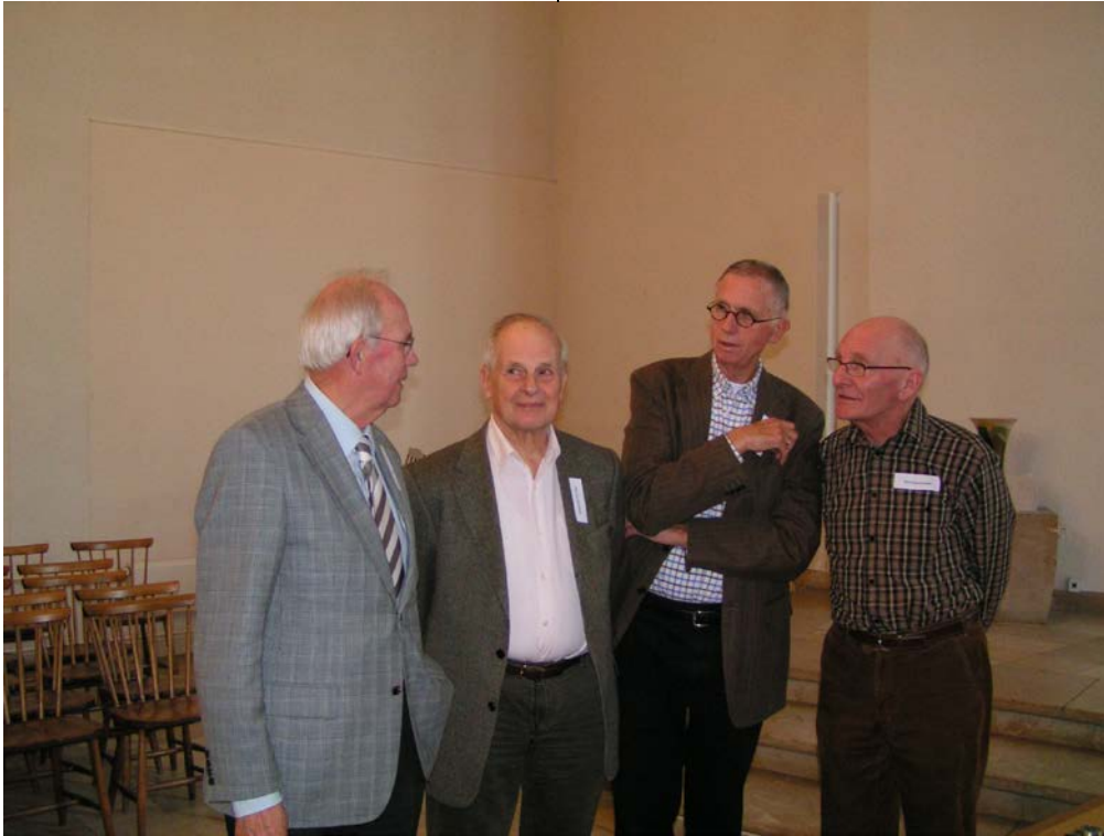
Jubileumviering 26 november 2009